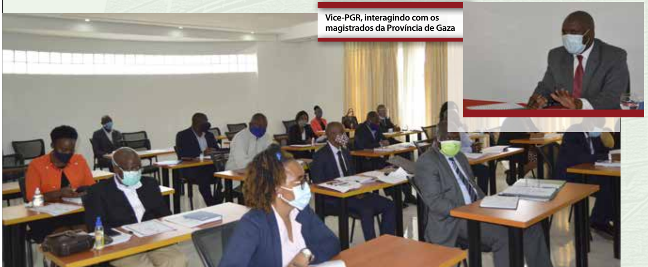
Vice-PGR, interagindo com os magistrados da Província de Gaza