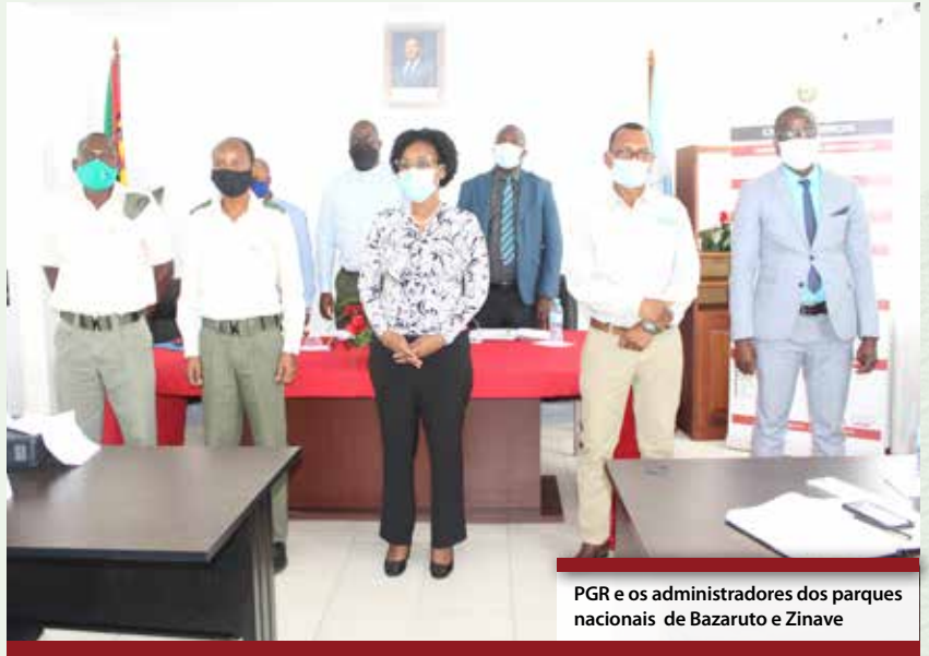
PGR e os administradores dos parques nacionais de Bazaruto e Zinave

Divulgação célere do novo código penal, código de processo penal e código de execução de penas no seio dos magistrados, investigadores, polícia e comunidade. ■