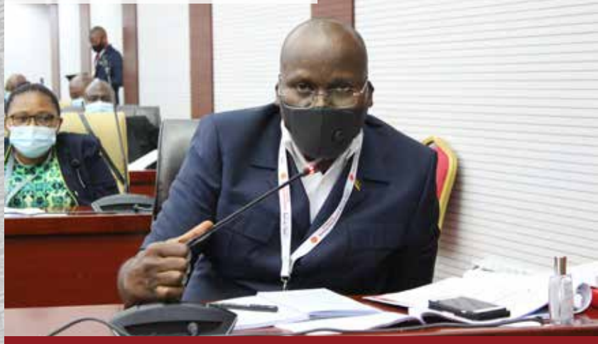
Pormenores das discussões em torno da reunião nacional