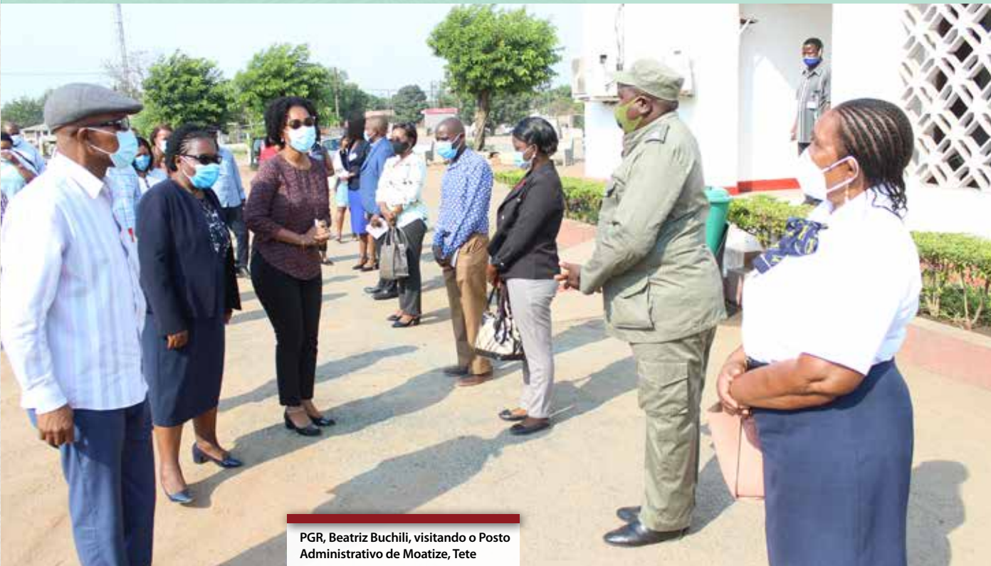
PGR, Beatriz Buchili, visitando o Posto Administrativo de Moatize, Tete