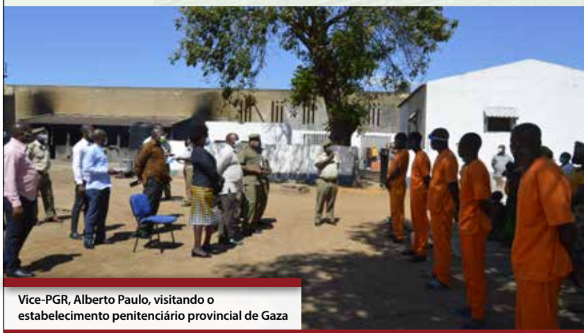
Vice-PGR, Alberto Paulo, visitando o estabelecimento penitenciário provincial de Gaza

Os encontros visavam verificar o grau de cumprimento das acções do Ministério Público, entre as quais, a defesa dos interesses colectivos e difusos, particularmente, a protecção do meio ambiente, exploração mineira, garimpo ilegal, abate ilegal de espécies de fauna e flora, contrabando, ordenamento territorial, reassentamento populacional e saúde pública. Outrossim, e como forma de prevenir e combater a corrupção nos órgãos da administração pública, a PGR manteve encontros de trabalho com os núcleos anticorrupção de escolas da Cidade de Inhambane.