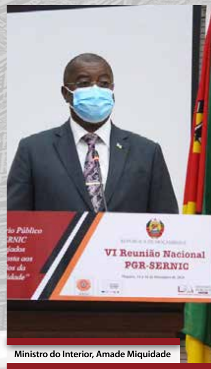
Ministro do Interior, Amade Miquidade

se adoptarem mecanismos que visam reduzir as pendências processuais, de modo a melhorar a qualidade do serviço prestado ao cidadão dentro dos limites da lei. Vincou que a emergência do terrorismo no nosso País chama atenção especial para a necessidade de uma profunda reflexão em torno dos meios de recolha de evidências probatórias.