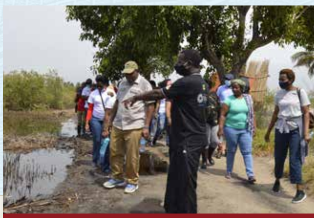
Magistrados em plena formação teórica e prática