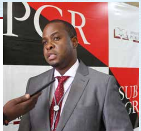
FREDDY JAMAL – Procurador Provincial da República-Chefe-Zambézia

Em termos de lições que podemos tirar, devemos continuar a melhorar e evoluir cada vez mais, sobretudo em resposta ao Discurso da Digníssima Procuradora-Geral da República, o qual referencia a modernização dos serviços, para responder à altura aos desafios que se colocam.