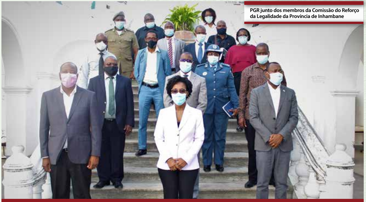
PGR junto dos membros da Comissão do Reforço da Legalidade da Província de Inhambane